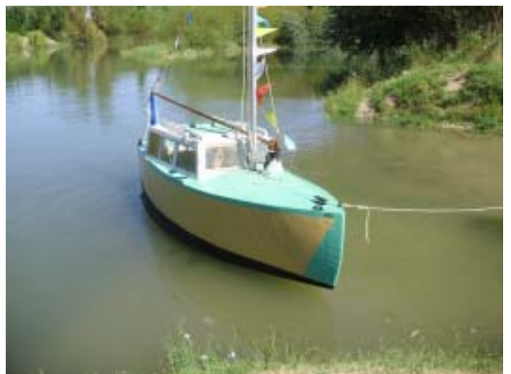
El velero construido artesanalmente ya flota en aguas del Río Chubut